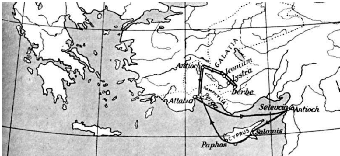
Paul's first missionary journey