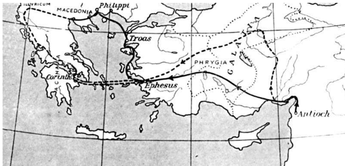
Paul's Third missionary journey